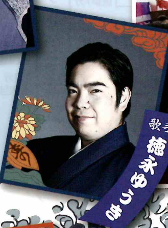
歌手 菅原 健児