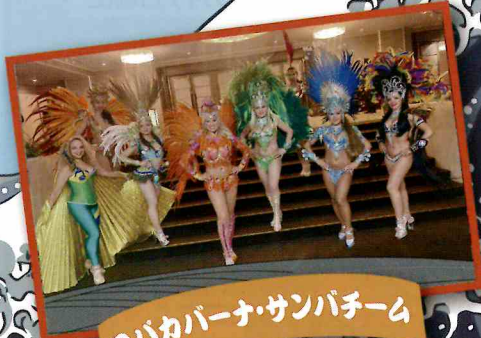
コバカーバー・サンパチーム

焼酎、さつま揚げ、お茶、 かるかん、あくまき等 懐かしいふるさとの味がやってくる